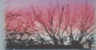
3. Tülay TALİMCİ