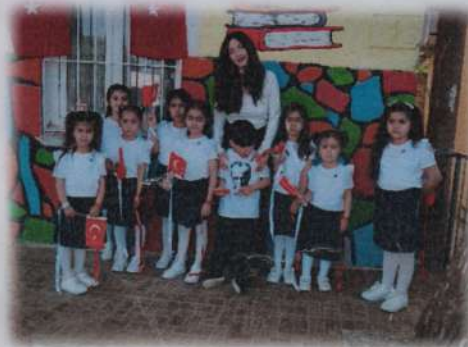
Ana sınıfı öğretmenimiz ve öğrencileri