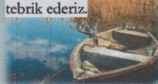
2. Dilek DALKILINÇ

Türkçe Öğretmenimiz Nalan KURT'un Sömestre Tatilinde düzenlediği Ortaokul Öğrencileri arasında "DOĞA VE İNSAN" konulu fotoğraf yarışmasında dereceye giren öğrencilerimiz; 1. Zeynep SÜRER, 2. Dilek DALKILINÇ ve 3. Tülay TALİMCİ'nin ödülleri ve başarı belgeleri verildi. Yarışmayı düzenleyen öğretmenimizi ve yarışmaya katılan tüm öğrencilerimizi tebrik ederiz.