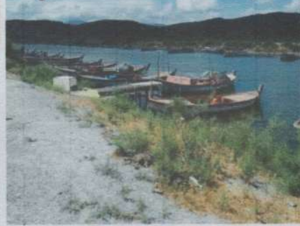
Üst resim köpüren sular. Yan resim gölde balıkçı barınağı.

Bu alandaki kirlilik öyle bir boyutta ki suyun yanında iki dakikadan fazla duramıyorsunuz. Su Kirliliği Kontrolü Yönetmeliği'ne göre 4. sınıf en kirli su haline geldiğini, OECD sınır değerinde "Hiperötrotfik" seviyesinde olduğunu belirtiyor. Beşparmak Dağlarından gelen dere suları ve yağmur suları ile beslenen doğu bölgesindeki Gölyaka kıyıları da ekolojik bozulmanın yoğun yaşadığı yerler arasında. Bafa Gölü'nde giderek artan kirlilik ve alınmayan önlemlerin göl tabanındaki azot ve fosfor birikimine neden olduğu belirtiliyor. Bunun alglerde patlamalara ve metan gazı artışlarına neden olduğu biliniyor.